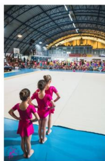
...se bomo preizkusile na tekmovanju