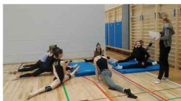
...bomo izboljšale špage