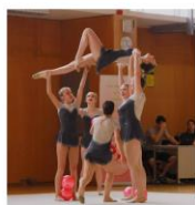
...bomo delale lifte