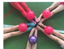
...bomo sestavile vajo z žogo