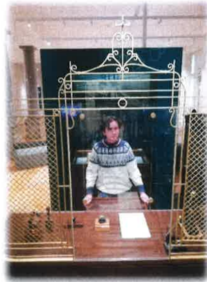
Bančno okence iz začetka 20. stoletja.