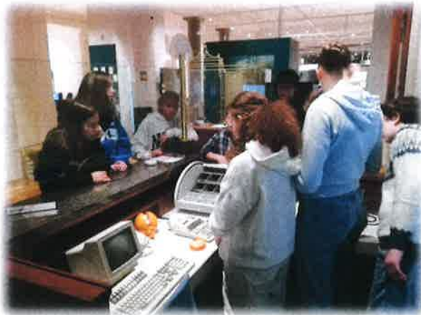
Učenci spoznavajo razlike med bančnimi okenci skozi čas. Stojijo okoli okenca iz zadnje četrtine 20. stoletja