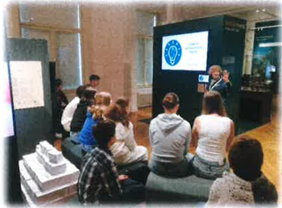
Multimedijski uvod je učence popeljal skozi 6 obdobjev razvoja denarja in bančništva po svetu.