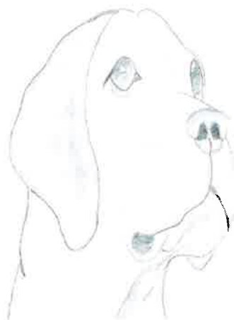
Mila Vučkovič, 6.b